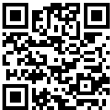
Сайт «Все о первой помощи»

сайте Минздрава России по ссылке https://minzdrav.gov.ru/documents/7188-algoritmy-pervoy-pomosch , доступ к которым возможен с основной страницы сайта через вкладку «Первая помощь».