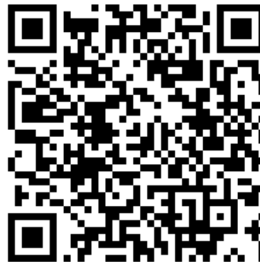
Сайт Минздрава России

Учитывая важность унификации первой помощи и использования для обучения современных учебно-методических материалов, письмом Министра здравоохранения Российской Федерации высшим исполнительным органам государственной власти субъектов Российской Федерации от 19 октября 2022 г. № 16-1/И/2-17651 было рекомендовано использовать разработанный УМК для обучения первой помощи.