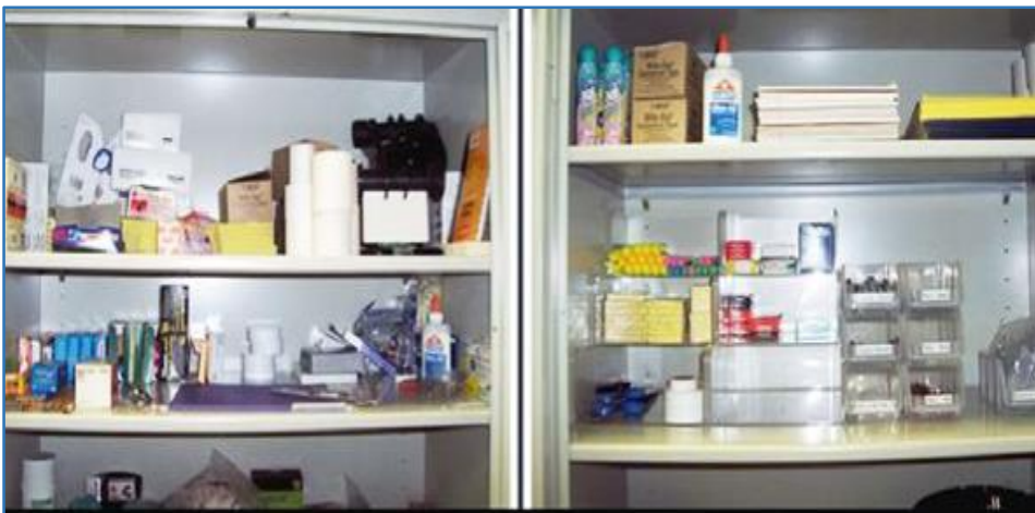
Фотографии было - стало